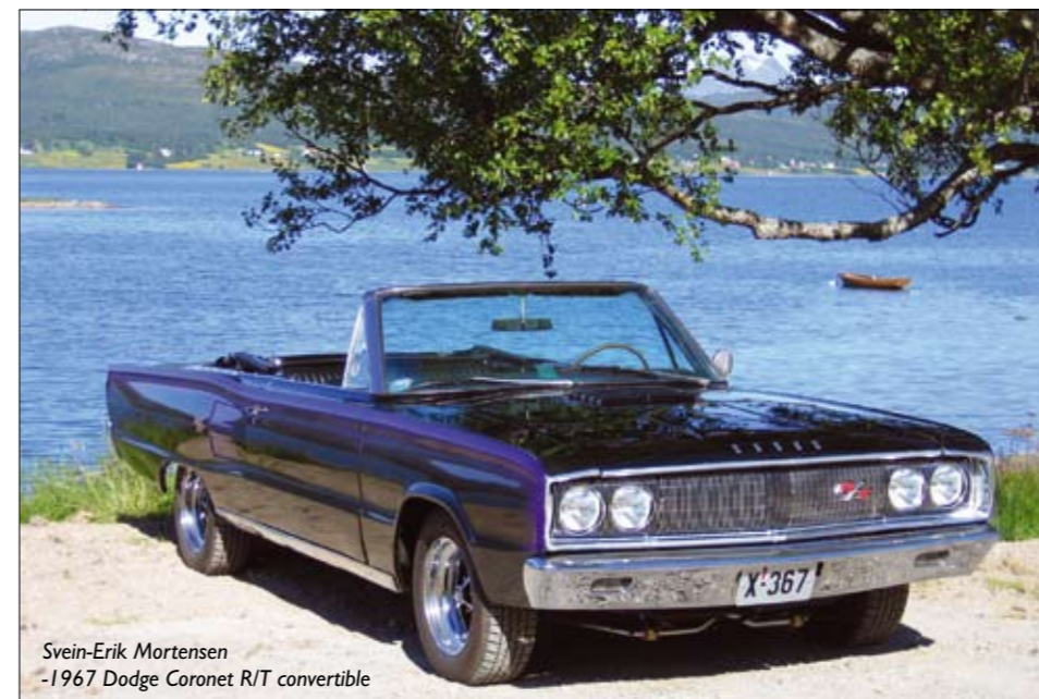
Svein-Erik Mortensen -1967 Dodge Coronet R/T convertible

e-post: wpc@lmk.no post: WPC Club of Norway v/ Håkon Lunde Strøm - Lurdalen - 3614 KONGSBERG web: http://wpc.lmk.no