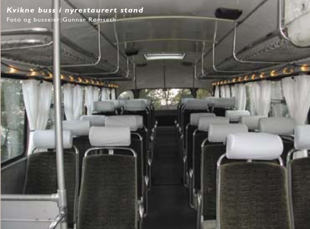
Kvikne buss i nyrestaurert stand Foto og busseier: Gunnar Rømseth

Det er Historisk Forum som holder orden på alle faktaopplysninger om norsk rutebilnæring fra tidenes morgen til dagsdato. Vognlister er hyppig tema.