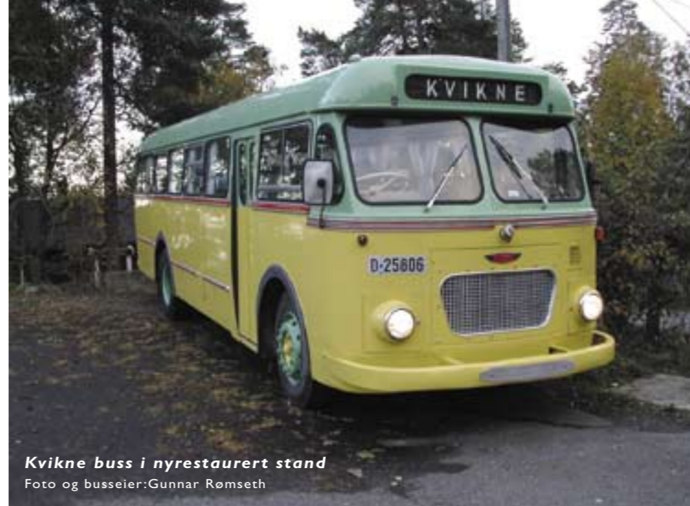
Kvikne buss i nyrestaurert stand

Viktig melding: Du behøver ikke være ansatt i et rutebilforetak, eller selv være eier av en veteranbuss, for å være medlem i Rutebilhistorisk Forening. Det er faktisk nok å være glad i rutebilen og historien omkring den.