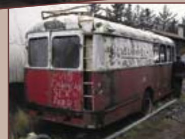
ex HSD og Røldal Handelslag