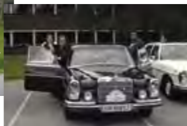
Et sterkt damelag i Stjerneløpet. Førde 2004